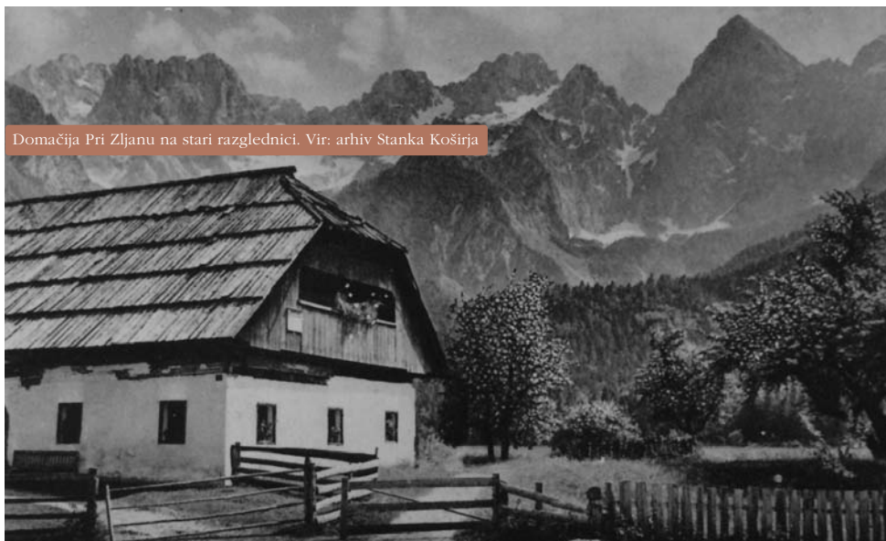
Domačija Pri Zljanu na stari razglednici.