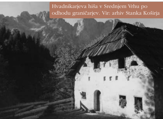
Hvadnikarjeva hiša v Srednjem Vrhu po odhodu graničarjev.

Ta hiša sliši meni, in vendar moja ni, ko drug za mano pride, jo znova zapusti. Ko tretjega mrliča nesli bodo iz nje, prijatelj, odgovori, čigava hiša je.