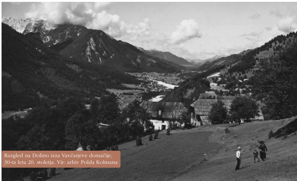
Razgled na Dolino izza Vavčarjeve domačije, 30-ta leta 20. stoletja.