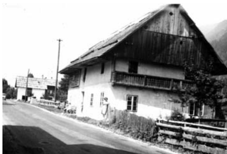
Nekdanja Šoštarjeva domačija v Zgornjih Rukah.

Domačini vedo povedati, da so prebivalci današnjega Gozda Martuljka svojo vas vedno imenovali Rute in sebe Rutarjani. Če je kdo Rutarjana poklical Martuljčan, je bil leta kar malo prizadet, saj so bili Martuljčani ali tako imenovani "hostarji", drvarji, ki so sekali les ob potoku Martuljek.