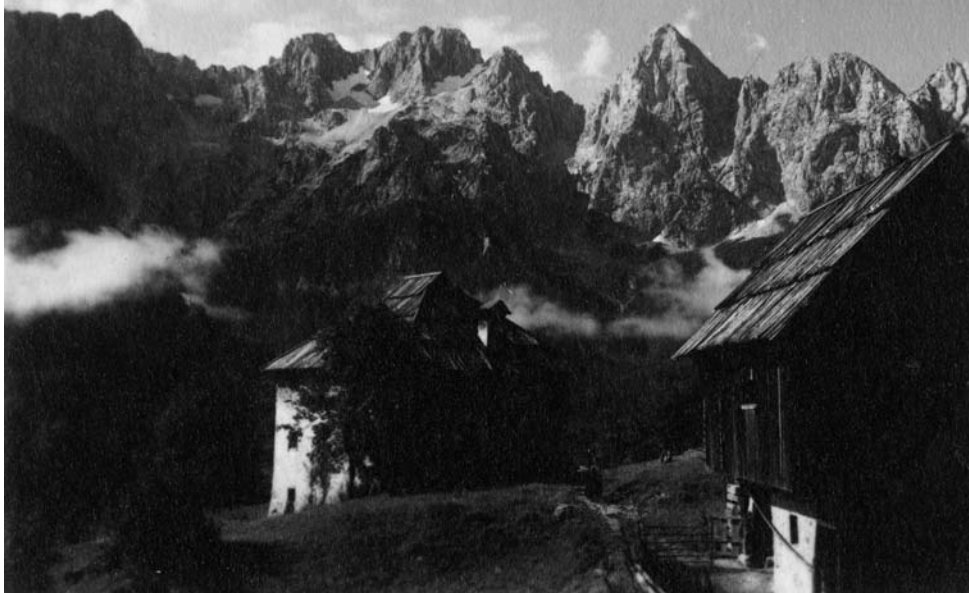
Stara razglednica Špikove skupine, v ospredju Bukavje.

samoglasnik. Ostrivec označuje ozek in dolg glas (npr. répa, móka), strešica zaznamuje širok in dolg glas (npr. pêta, rôka), krativec pa širok in kratek glas (npr. kmèt, nastòp). Pri zapisu je uporabljen tudi znak za polglasnik "ə", ki ga izgovarjamo kot samoglasnik v besedah pes [pəs], vrtnar [vərtnár]. Poknjžena oblika hišnega imena je prirejen zapis hišnega imena, zapisan z znaki slovenske abecede ter enotno končnico -u.